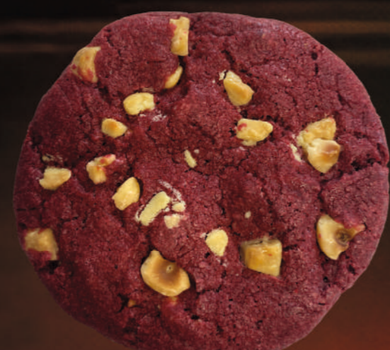
Cookie Red Velvet