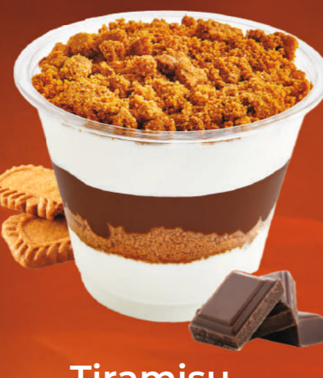
Tiramisu selon saison